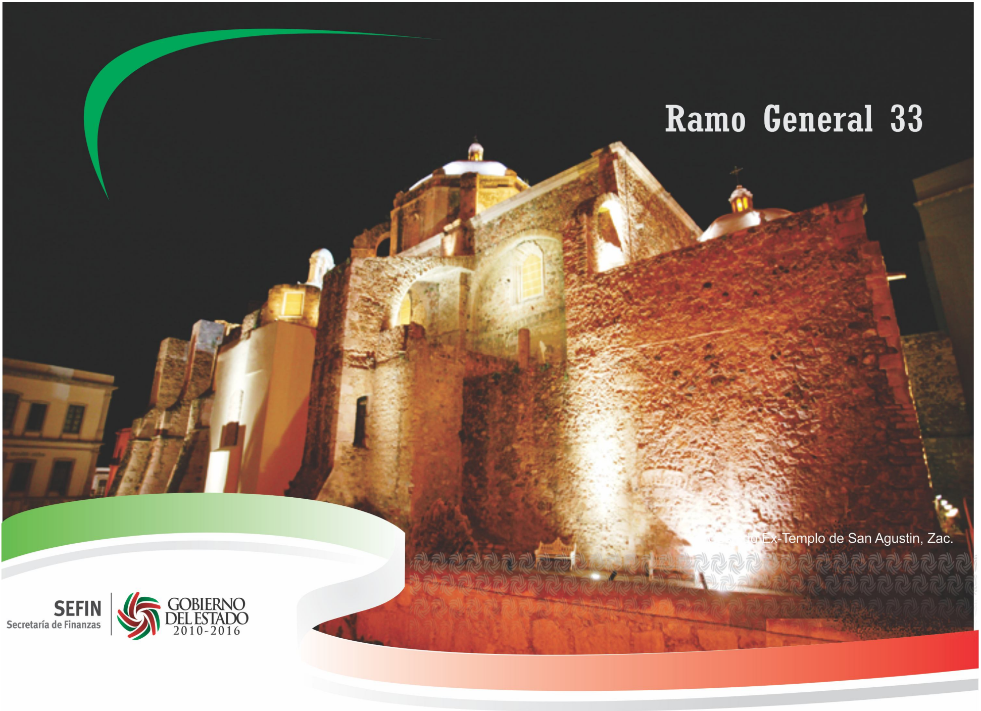
Ex-Templo de San Agustín, Zac.