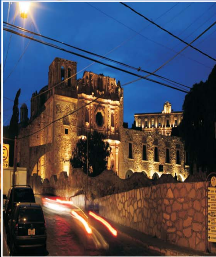
Museo Rafael Coronel, Zac.