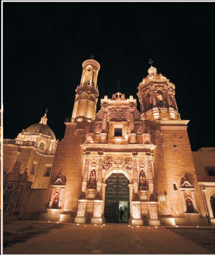
Templo de los Franciscanos, Guadalupe, Zac.