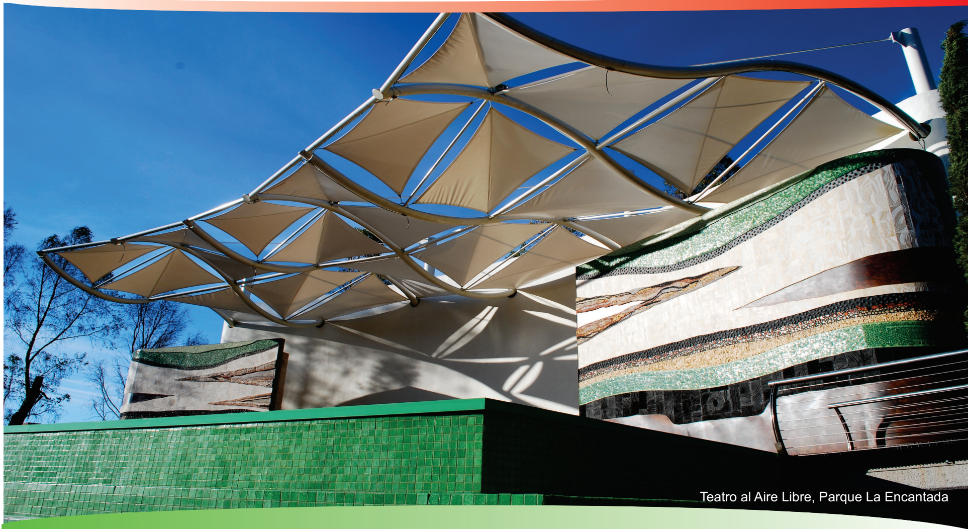
Teatro al Aire Libre, Parque La Encantada