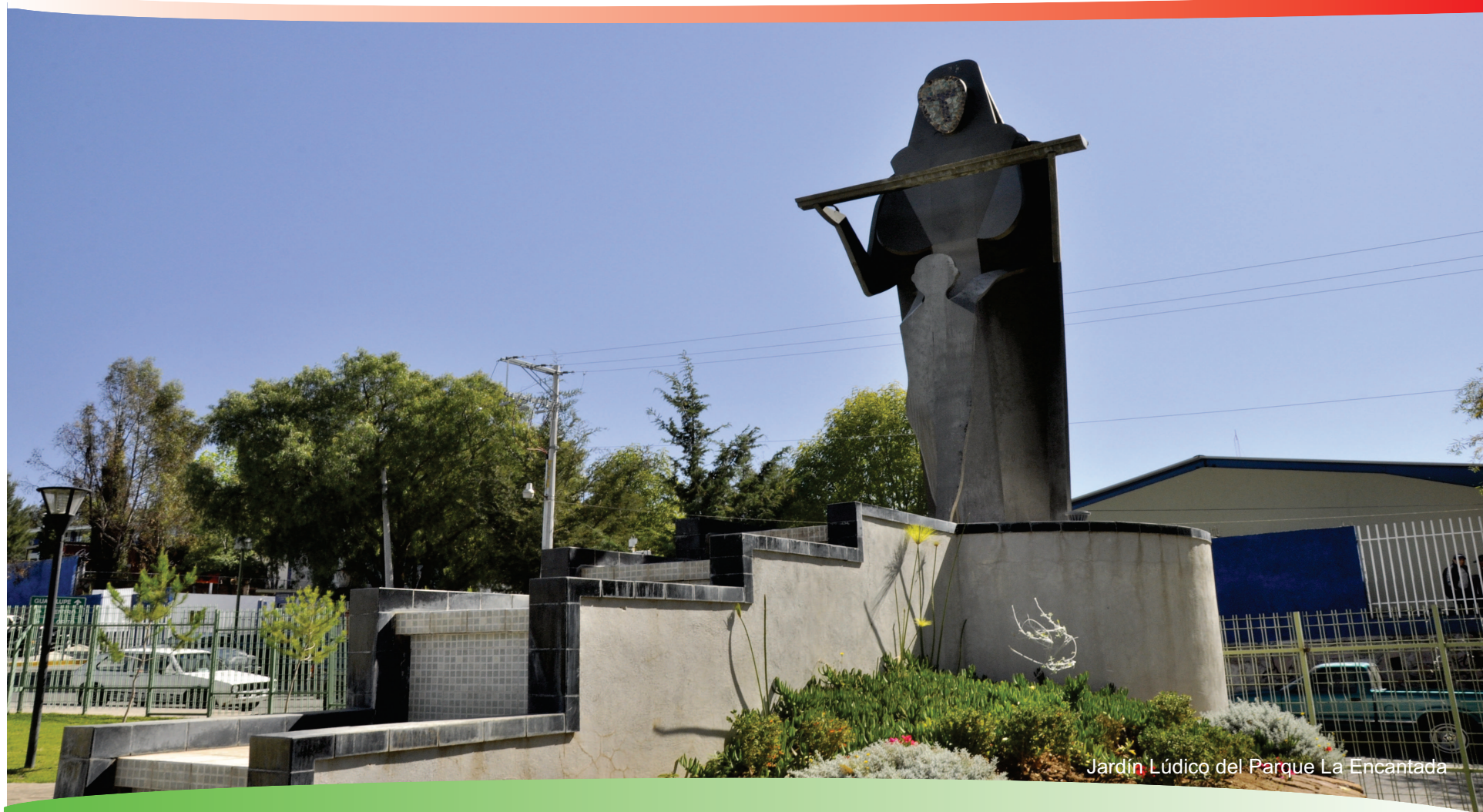
Jardín Lúdico del Parque La Encantada