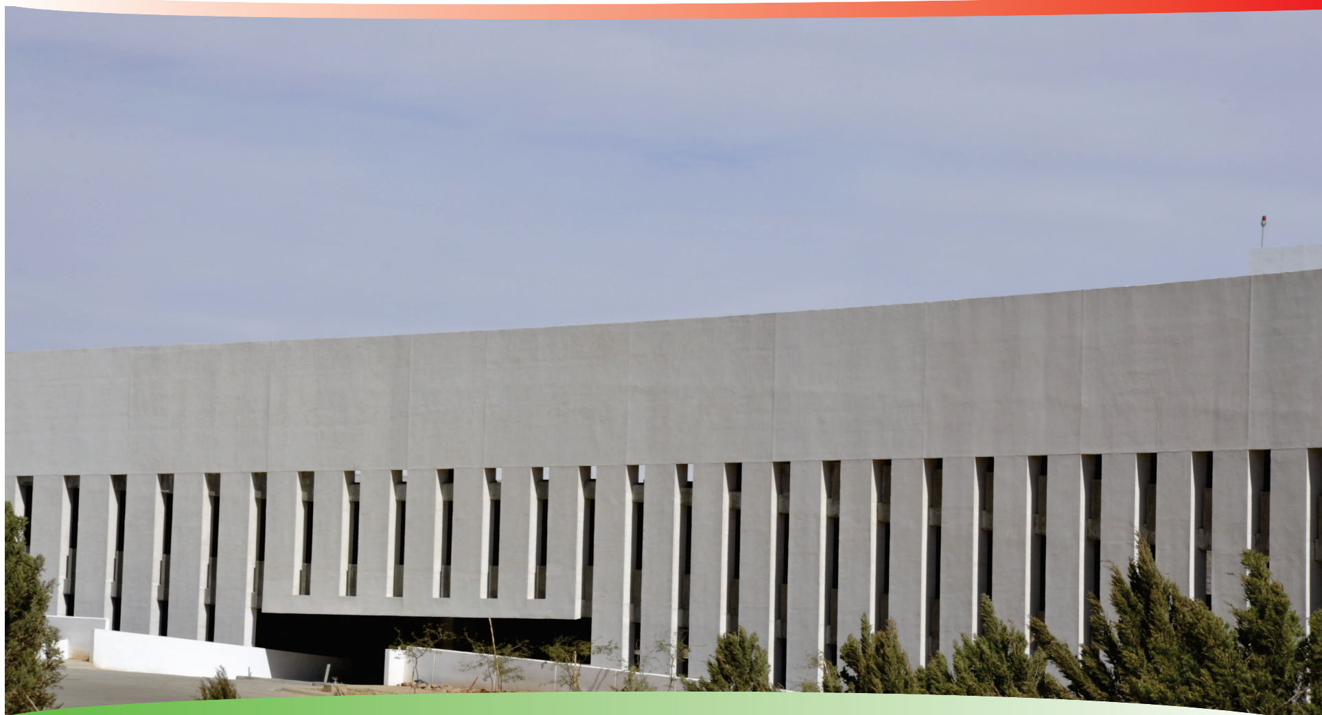
Estacionamiento de Ciudad Administrativa