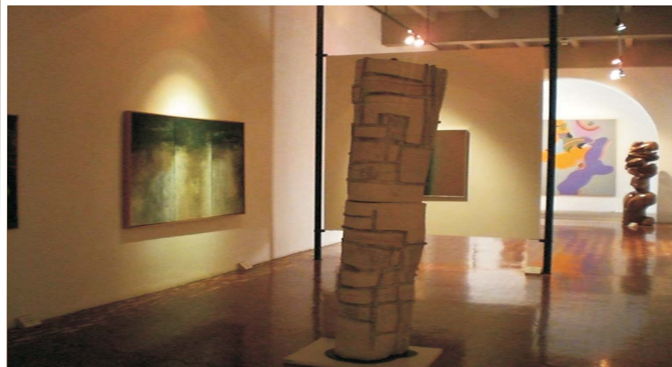
Museo Manuel Felguérez, Zac.