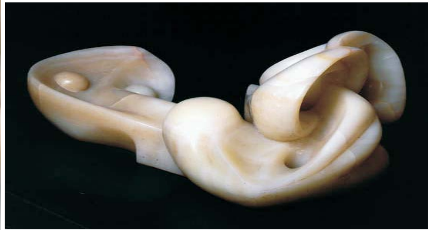
Mujer Museo Pedro Coronel, Zac.