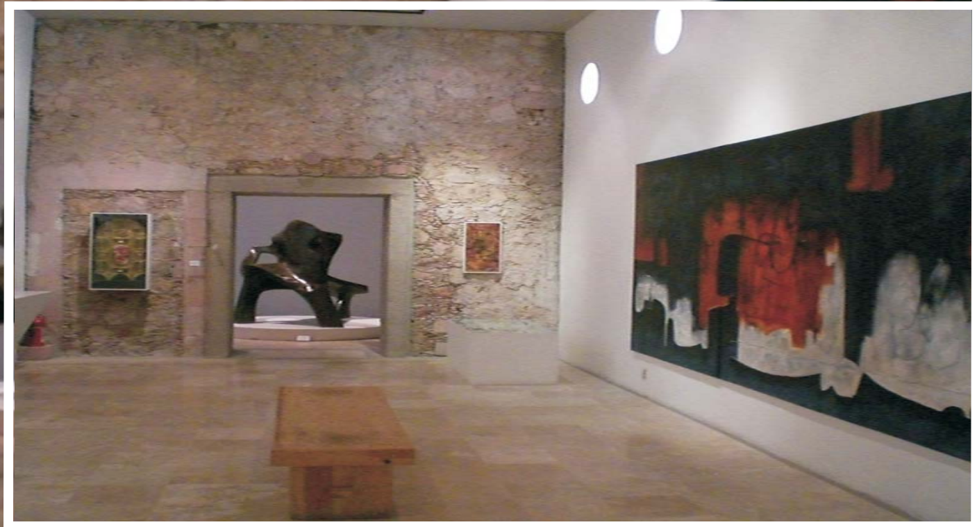
Museo Manuel Felguérez, Zac.