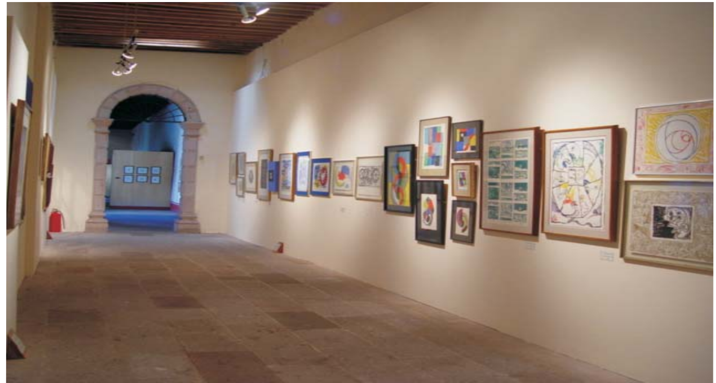
Museo Pedro Coronel, Zac.