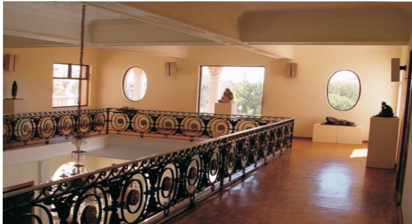
Museo Francisco Goitia, Zac.