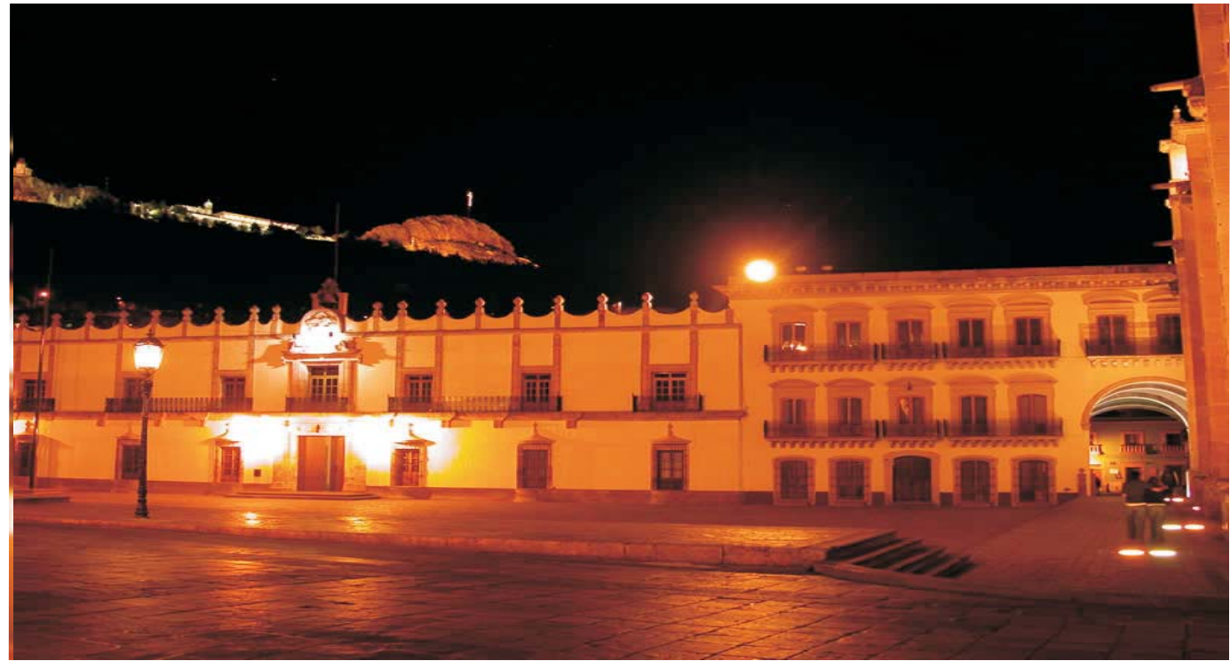
Plaza de Armas, Zac.