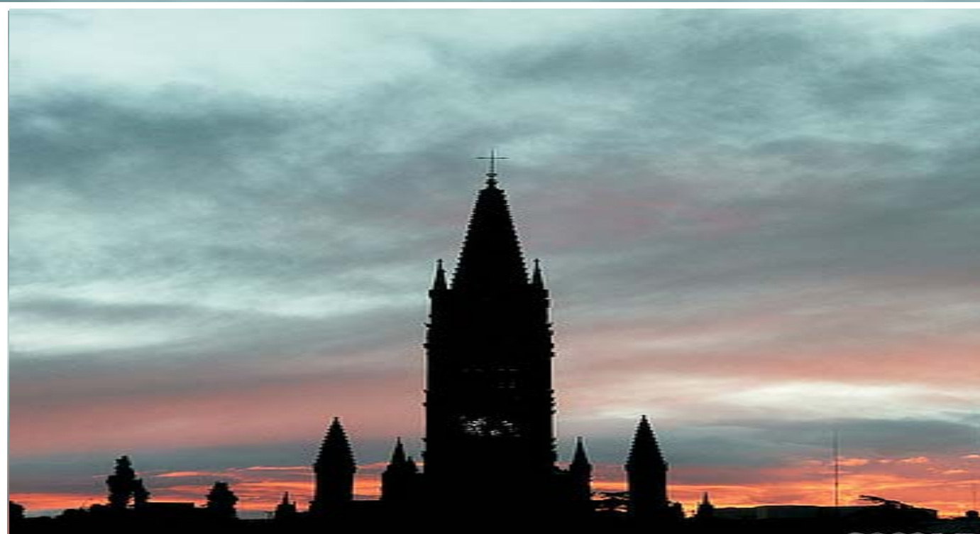
Siluetas del Templo de Fátima, Zac.