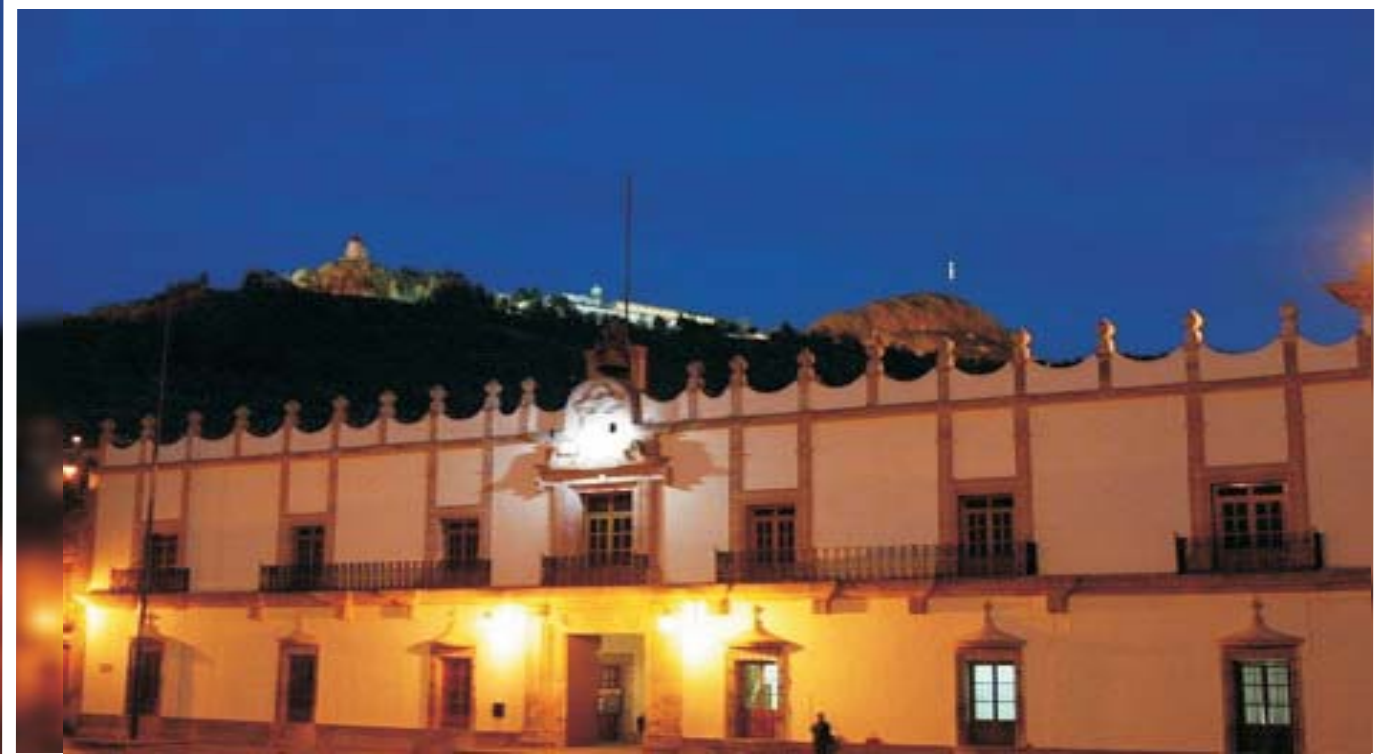
Palacio de Gobierno, Zacatecas.