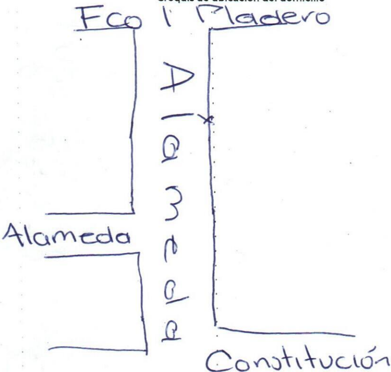
Croquis de ubicación del domicilio