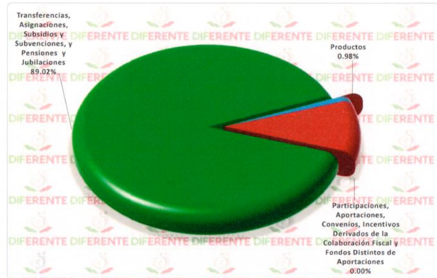
COMPARACIÓN DEL INGRESO RECAUDADO EN FUNSIÓN DEL PRESUPUESTO MODIFICADO